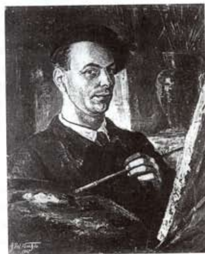
Aronne Del Vecchio Autoritratto 1947