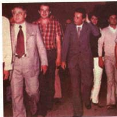
Magrini durante la visita di Berlinguer

I ricordi dell'autore sono suddivisi in cinque capitoli. Nel primo, dal 1936 al 1954, i ricordi dell'in-