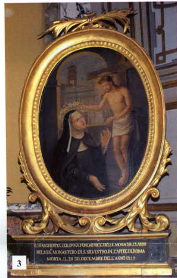
LA S. MARGHERITA COLONNA FONDATRICE DELL'E MONACATO CLAUDIO NEL VEC. MONASTERO DI S. SILVESTRO IN CAPITALE DI ROMA MORTA IL III 30. DICEMBRE DELL'ANNO 1419