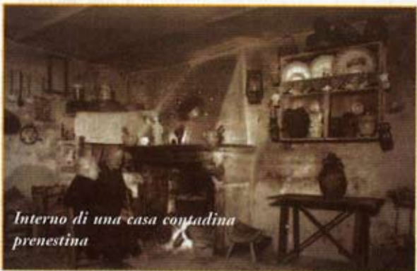
Interno di una casa contadina prenestina