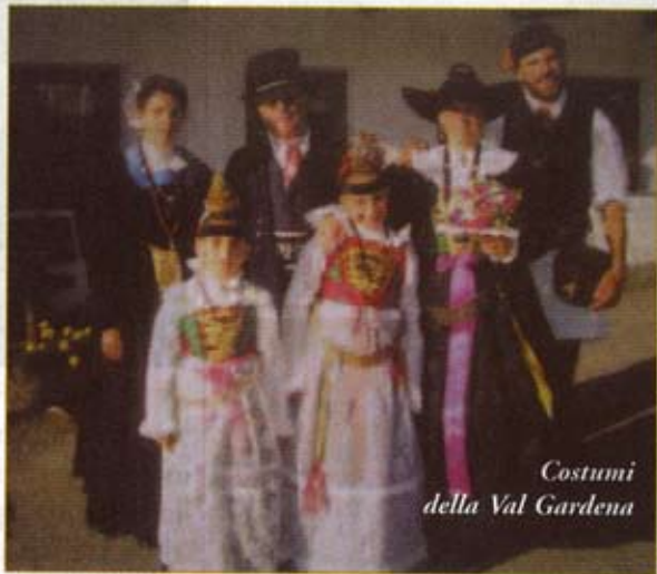
Costumi della Val Gardena