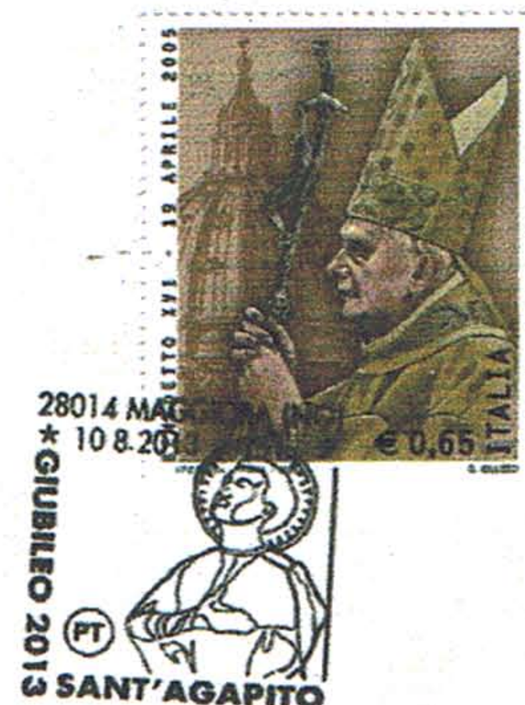
Maggiora - 10/08/2013 Festeggiamenti Giubilarì Sant'Agapito Mostra tematica "Filatelia Religiosa"

neta recante una fiaccola nella mano sinistra; in basso la didascalia "Trasporto FIACCOLA VOTIVA PALESTRINA-MAGGIORA 7-10/08/2013".